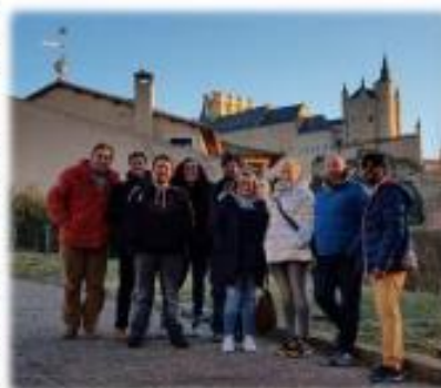
Ángel y Solé

Eillos son conscientes de ser un grupo muy heterogéneo, pero están decididos a emprender el apasionante camino hacia una comunidad en la que compartir la fe y el seguimiento de Jesús. Desde aquí les deseamos mucha suerte y que Dios acompañe su camino.